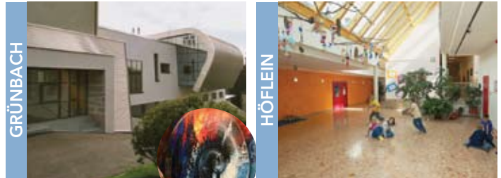
GRÜNBACH Barbarahalle Forum Grünbach

Bergbaumuseum Grünbach Am Neuschacht 5 2733 Grünbach Info: Gemeinde Grünbach Tel. +43 (2637) 2225