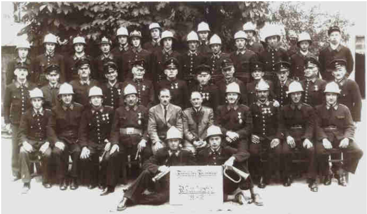
70 Jahr-Jubiläum 1951